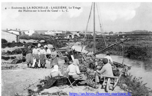
Carte postale, commune de Nieul-sur-Mer, vers 1900-1930.

En bordure de l'océan, à quelques km au nord de La Rochelle, Nieul-sur-Mer est au début du 20 ème siècle une bourgade d'un peu plus d'un millier d'habitants. L'ostréiculture y est alors une des principales activités, notamment au hameau de Lauzières.