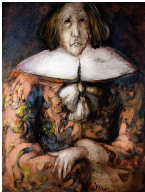
Albert Deman, Le clown triste , huile sur toile