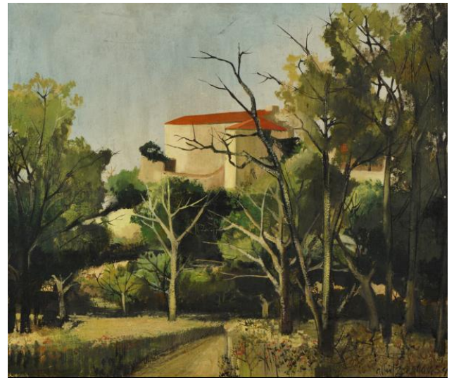
Albert Deman, La maison dans les arbres , huile sur toile, 1954

À Cannes, une galerie l'expose à longueur d'année. Sur la Croisette, un hôtel affiche ses toiles dans la salle de restaurant. Nous le voyons souvent, aux Herbiers mais surtout chez lui, rue Sur les Murs à La Rochelle. La surprise est grande pour ses enfants lorsque nous réussissons à le faire quitter son "antre" pour des voyages à l'étranger : l'Espagne, le Portugal lui donnent l'occasion de découvrir de nouvelles contrées : ses peintures traduisent les émotions qu'il a ressenties face à de nouveaux paysages. Un voyage en Bretagne le plonge dans des peintures aux couleurs de la mer et des rochers. Dans le Sud, il emmagasine dans son regard les cascades dévalant les collines.