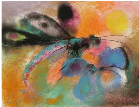
Albert Deman, Libellule et fleur , pastel

D'un style figuratif, l'artiste a évolué vers une peinture plus lyrique et abstraite, toujours marquée par son caractère révolté et contestataire.