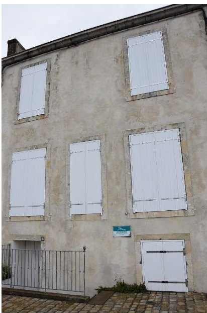
La "maison Albert Deman" à la Rochelle

En 1998, la maison qu'il avait occupée durant vingt ans à la Rochelle est rachetée par la ville et le département afin d'en faire un lieu d'accueil pour artistes qui sera inauguré en 2011.