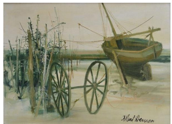
Albert Deman, Marée basse , huile sur toile