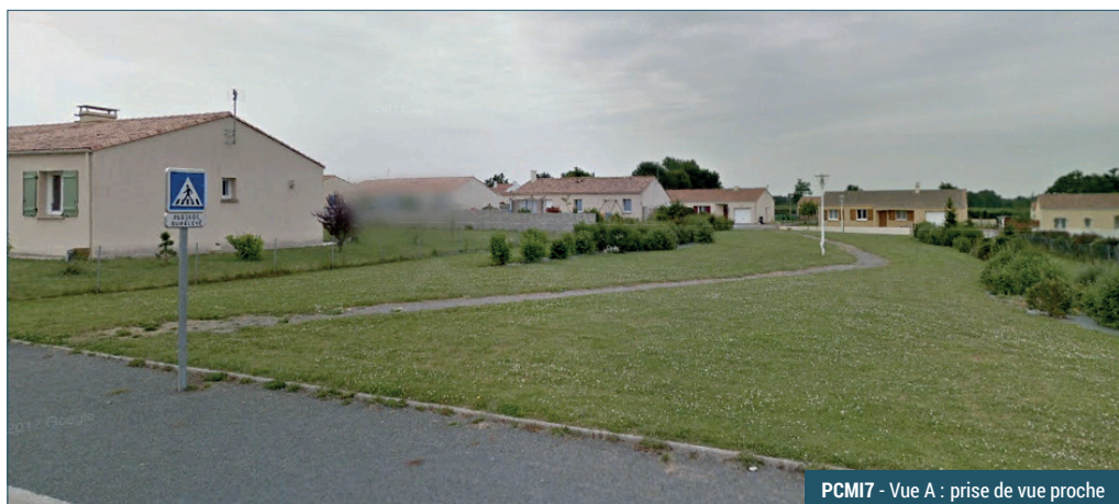
PCMI7 - Vue A : prise de vue proche