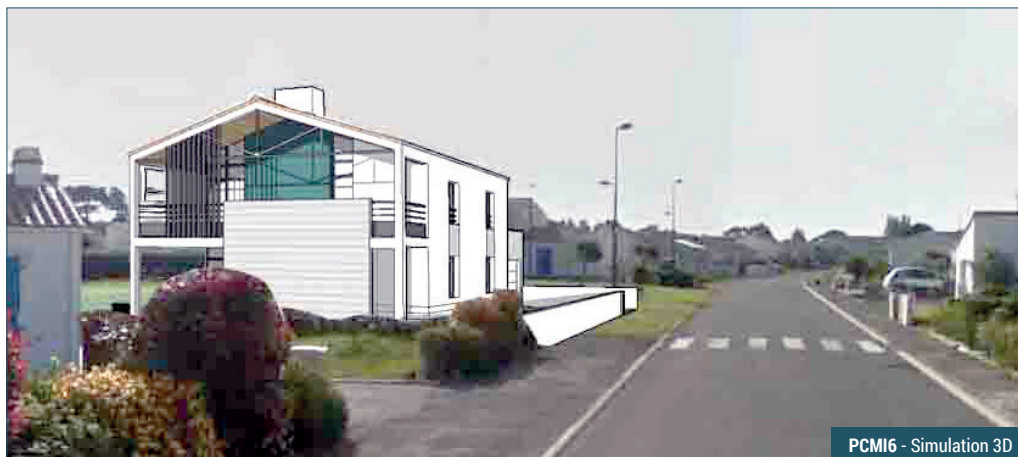
PCMI6 - Simulation 3D