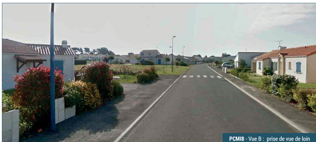
PCMI8 - Vue B : prise de vue de loin